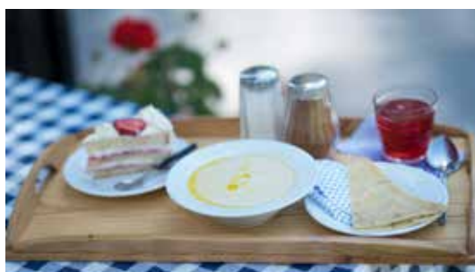
Rømmegrøt og hjemmelaget lefsekling er spesialiteter