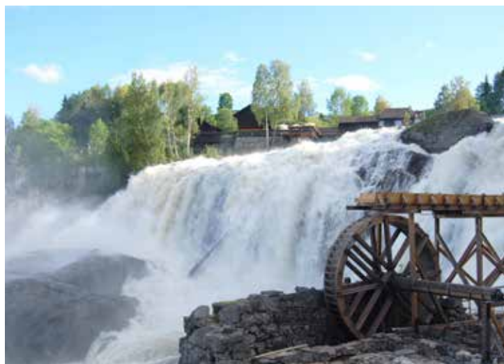
Haugfossen med Thranestua kafé, Landhandleriet og Stein- og Smykkebutikken på toppen