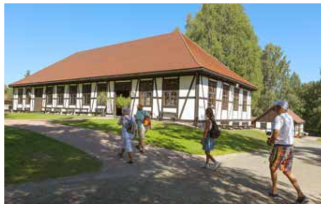
Glasshytten er vår "storstue"

Pris pr. person med menyforslag 1b kr 385,-