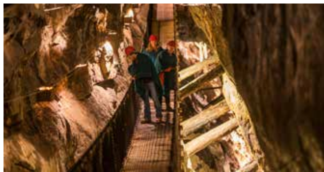
Hengebroen i Koboltgruvene strekker seg 32 meter over strossen

Kontakt oss for bestilling og mer informasjon.