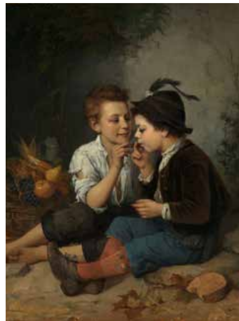
Mathilde Dietrichson - Sigarrøykende unger, 1877

Utstillingen er en fortelling om hennes kjærlighet for livet, kunsten og familien. Hun reiste Europa og Midtøsten rundt og kombinerte kunstneryrket med rollen som mor og hustru. Med dette brøt hun fullstendig med det som vanlig for kvinnelige kunstnere i hennes samtid. I utstillingens fortelling inngår også et utvalg av hennes samtidige kvinnelige kunstnere.