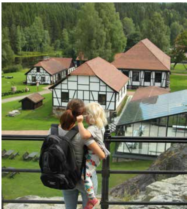
Utsikt mot Blaafarveværket med Glasshytten, Den Blå butikk og Bødtkerkroa

Vi tilbyr guidede omvisninger på alle kunstutstillinger, historisk omvisning på Blaafarveværket og flere forskjellige guidede turer i Koboltgruvene.