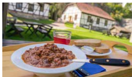
Gryteretten vår er blant de mest populære rettene.