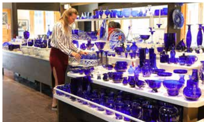
Den Blå Butikk på Blaafarveværket