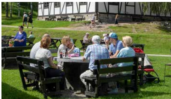
Vi kan tilby en rekke guidede turer inn i Koboltgruvene

Vi har gjenskapt og viser frem det kolossale industrianlegget som Blaafarveværket var. I Skuterudåsen i 1772, oppstod verdens største koboltgruver igjennom 120 års drift. Vi byr på en glemt norsk historie. Den oppstod lokalt og ekspanderte globalt, der Blaafarveværket i sin storhetstid hadde 80 % av verdensmarkedet. I dag forsøker vi å skape helhet og sammenheng i dette store kulturminnet. Våre årlige kunstutstillinger har vært arrangert i over 40 år. De er av høyeste kvalitet, med fokus på nordisk kunst og er med på å gi deg et mangfold av store opplevelser igjennom dagen.