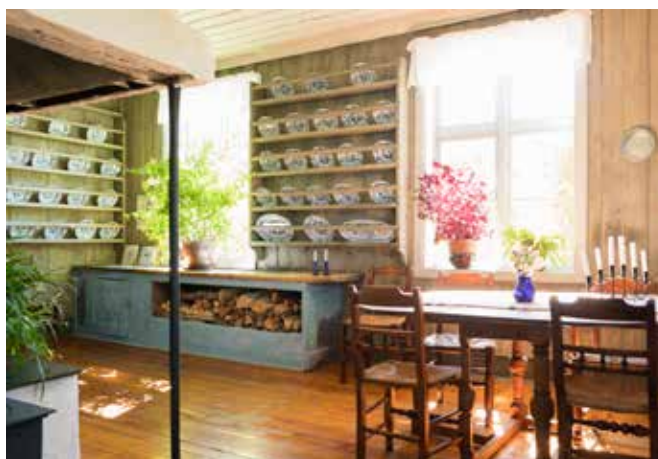
Nyfossum er restaurert og innredet som et hjem fra 1820-årene

Alle turforslag tilpasses etter gruppens behov. Se side 10 og 11 for utvidet meny. Alle matpriser gjelder servering én gang. Prisene forutsetter at hele gruppen bestiller samme rett fra menyen. Gi beskjed om matallergier i god tid.