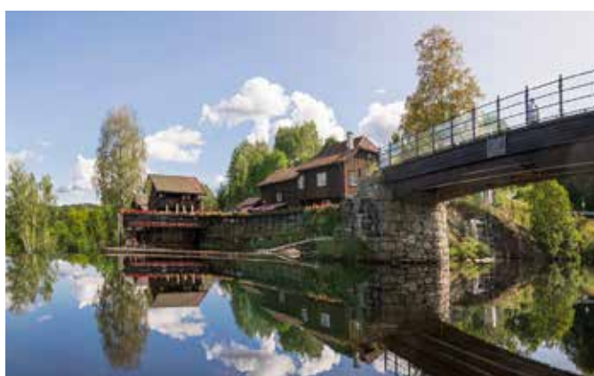
Butikkene og kafeen på Haugfosstråkka med Haugfoss bro til høyre