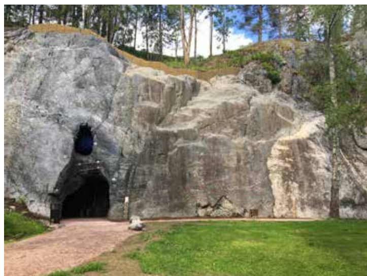
Barnas Buldrehule, ny i 2020. Gratistilbud til barna!