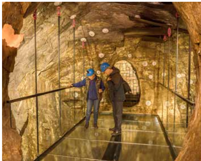
Nordens første underjordiske glassgulv.

Alle turforslag tilpasses etter gruppens behov. Se side 10 og 11 for utvidet meny. Alle matpriser gjelder servering én gang. Prisene forutsetter at hele gruppen bestiller samme rett fra menyen. Gi beskjed om matallergier i god tid.