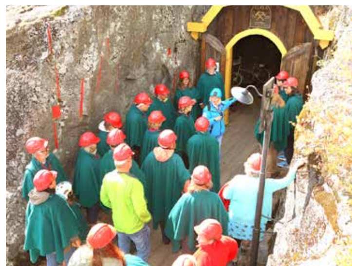
Guidet gruvetur i Koboltgruvene fra 1700-tallet