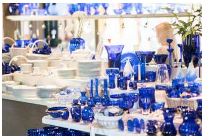
Den Blå Butikk har et stort, unikt utvalg i alle prisklasser.