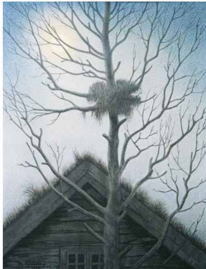
Th. Kittelsen: Øde