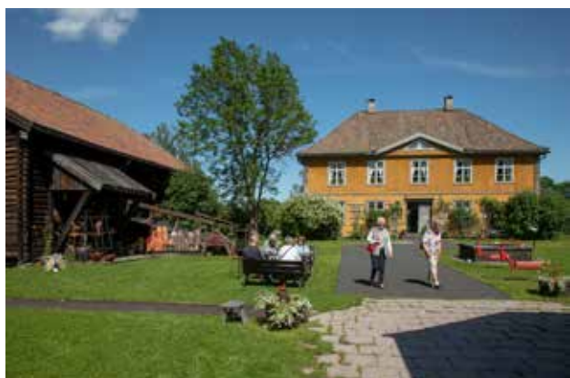
Direktørboligen på Nyfossum med hage og to kunstutstillinger