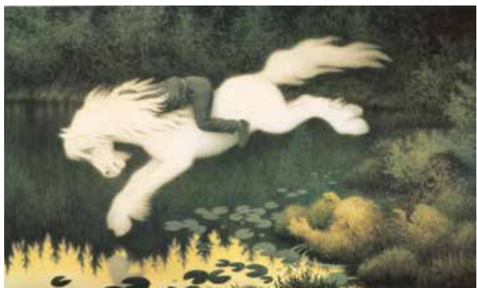
Kittelsenmuseet har en betydelig samling av Kittelsens originalkunst