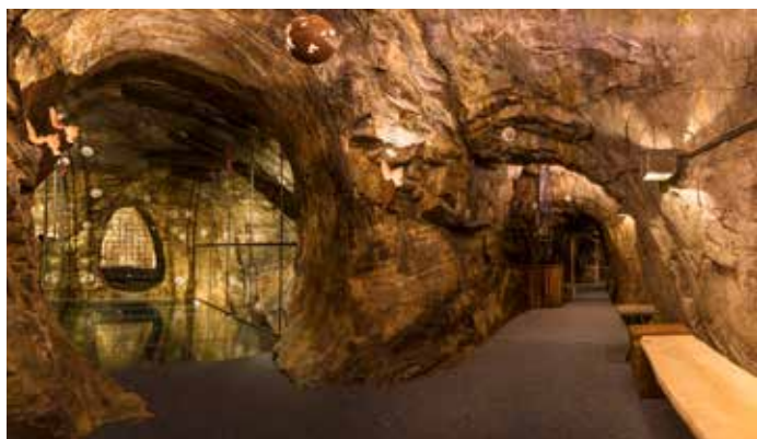
Vi kan tilby en rekke guidede turer inn i Koboltgruvene

Vi har gjenskapt og viser frem det kolossale industrianlegget som Blaafarveværket var. I Skuterudåsen i 1772, oppstod verdens største koboltgruver igjennom 120 års drift. Vi byr på en glemt norsk historie. Den oppstod lokalt og ekspanderte globalt, der Blaafarveværket i sin storhetstid hadde 80 % av verdensmarkedet. I dag forsøker vi å skape helhet og sammenheng i dette store kulturminnet. Våre årlige kunstutstillinger har vært arrangert i over 40 år. De er av høyeste kvalitet, med fokus på nordisk kunst og er med på å gi deg et mangfold av store opplevelser igjennom dagen.