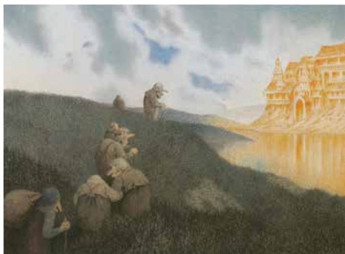
Theodor Kittelsen – På vei til Gildet