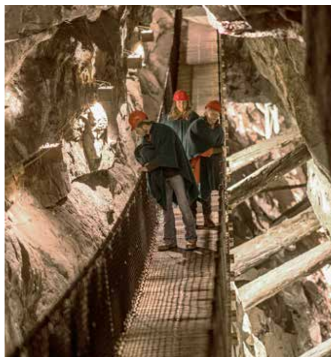
Hengebroen i Koboltgruvene strekker seg 32 meter gjennom Glück Auf Strosse

Alle turforslag tilpasses etter gruppens behov. Se side 10 og 11 for utvidet meny. Alle matpriser gjelder servering én gang. Prisene forutsetter at hele gruppen bestiller samme rett fra menyen. Gi beskjed om matallergier i god tid.