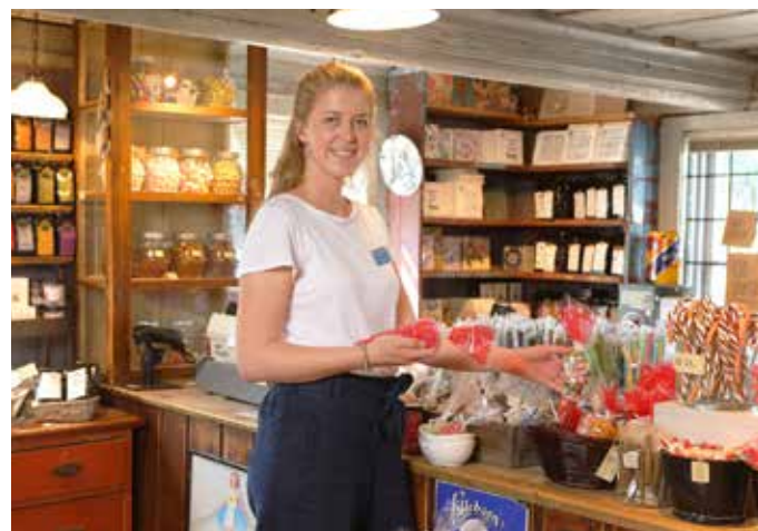
Landhandleriet på Haugfoss har et spennende utvalg av gammeldagse varer