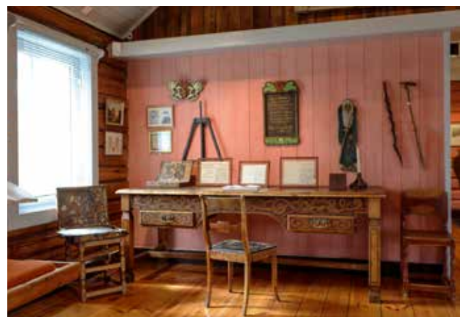
Kittelsenmuseet har en betydelig samling av Kittelsens originalkunst