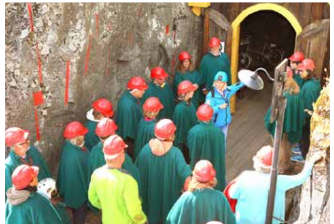
Vi kan tilby en rekke forskjellige guidede turer inn i Koboltgruvene