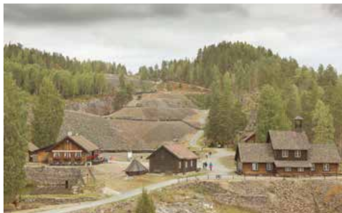
De mektige felshaugene vitner om menneskes arbeid gjennom 120 år på Koboltgruvene