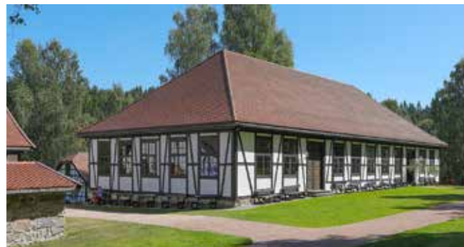
Glasshytten fra 1779

Haugfosstråkka ligger på toppen av Haugfossen med sine 39 meters fossefall. Her ligger Thranestua kafé, et gammeldags landhandleri og Stein- og smykkebutikken med et særegent utvalg av stein, smykker, smijern og interiørdesign.