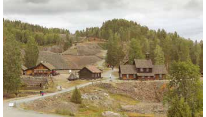
Koboltgruvene var Norges største arbeidsplass

Museet er et nasjonalt museum for kunstneren Theodor Kittelsen (1857-1914) og viser over 50 verker i forskjellige teknikker. En magisk opplevelse finnes i Kittelsens naturpoesi som ble skapt i dette landskapet.