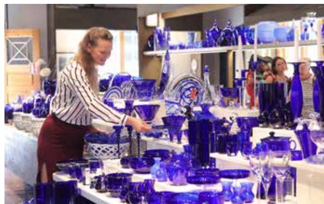
Den Blå Butikk har Skandinavias største utvalg i koboltblått glass