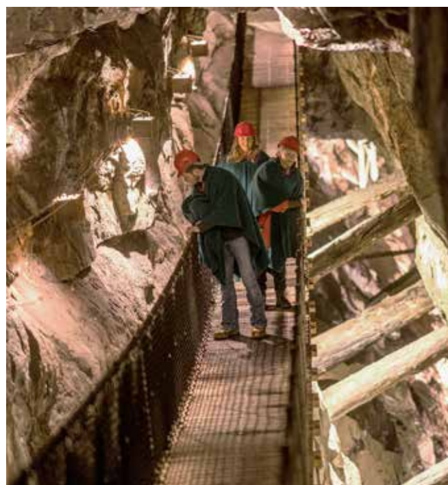
Hengebroen i Koboltgruvene strekker seg 32 meter over strossen

Alle turforslag tilpasses etter gruppens behov. Se side 10 og 11 for utvidet meny. Alle matpriser gjelder servering én gang. Det forutsettes at hele gruppen bestiller samme rett fra menyen. Gi beskjed om matallergier i god tid.