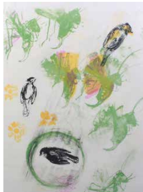
Lillebet Foss: Komposisjon med fugler