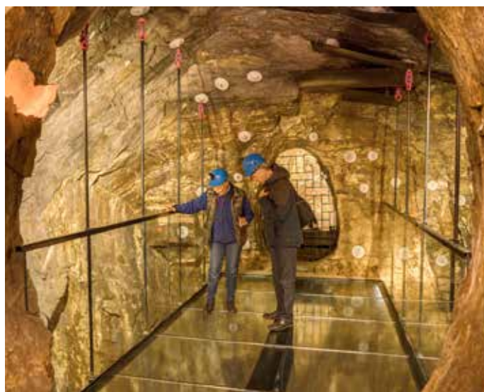
Nordens første glassgulv i en gruve