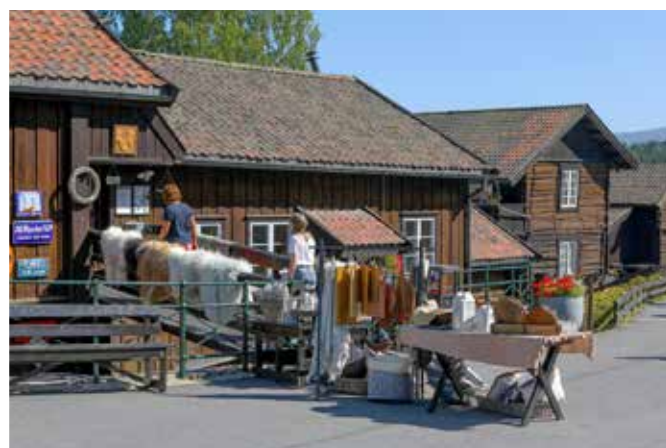
Haugfosstråkka ligger på toppen av Haugfossen