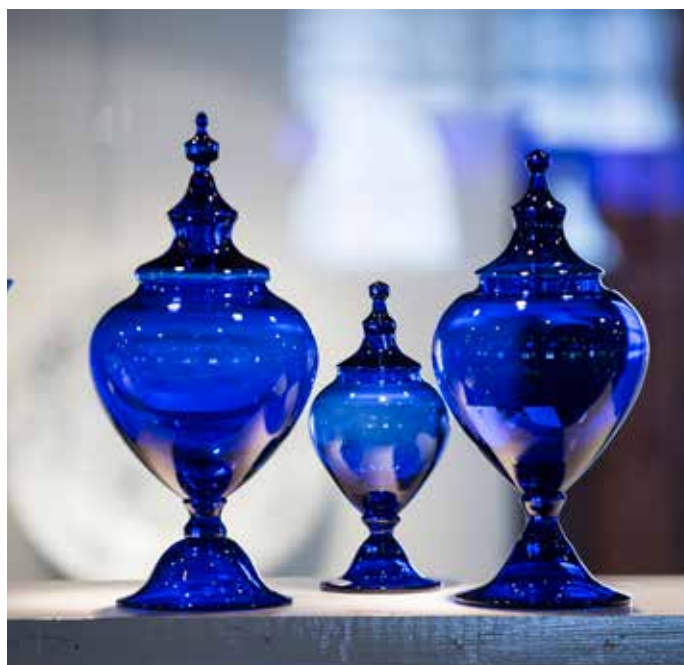
Potpurrikrukken kan brukes til oppbevaring av velduftende blader

Alle turforslag tilpasses etter gruppens behov. Se side 10 og 11 for utvidet meny. Alle matpriser gjelder servering én gang. Det forutsettes at hele gruppen bestiller samme rett fra menyen. Gi beskjed om matallergier i god tid.