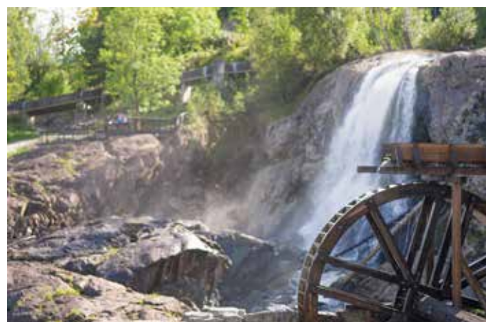
Den mektige Haugfossen gav kraft til Blaafarveværkets tekniske drift

Alle turforslag tilpasses etter gruppens behov. Se side 10 og 11 for utvidet meny. Alle matpriser gjelder servering én gang. Det forutsettes at hele gruppen bestiller samme rett fra menyen. Gi beskjed om matallergier i god tid.