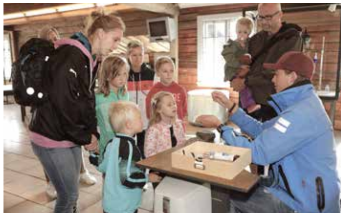
Eksperimentet "Den Blå Perle" synliggjør veien fra gråstein til blå farge