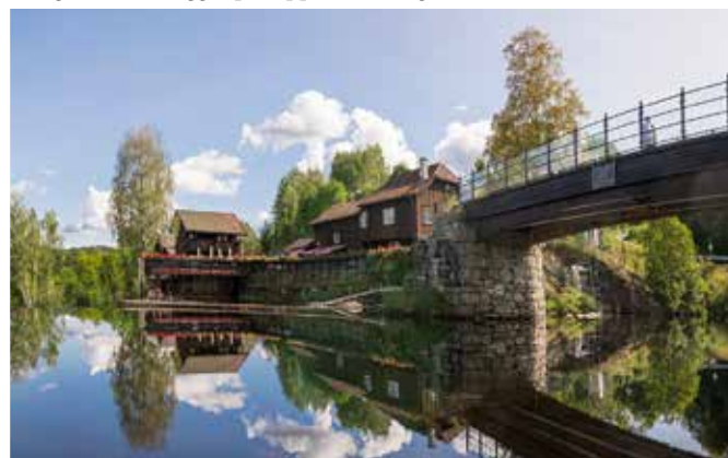
Butikkene og kaféen på Haugfosstråkka med Haugfoss bro til høyre